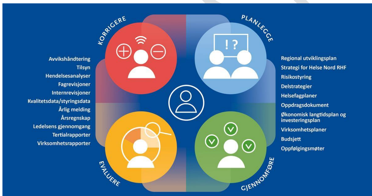
Figur 1- Helse Nord RHF's helhetlige styringsprosess. Vi planlegger og styrer helhetlig og langsiktig i tråd med forskrift om ledelse og kvalitetsforbedring i helse- og omsorgstjenesten.

Helse Nord RHF planlegger og styrer helhetlig og langsiktig. Vi skal være tydelige og forutsigbare i drift og utvikling av spesialisthelsetjenesten. Vår styringsprosess følger forskrift om ledelse og kvalitetsforbedring i helse- og omsorgstjenesten, hvor vi plikter å planlegge, gjennomføre, evaluere og korrigere . Dette sikrer helhet og sammenheng, slik figur 1 illustrerer.