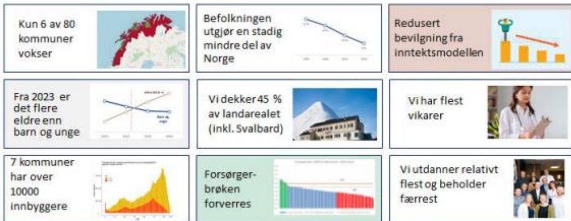
Figur 2 - Helse Nords særlige utfordringer

Helse Nords særlige utfordringer er illustrert i figuren under.