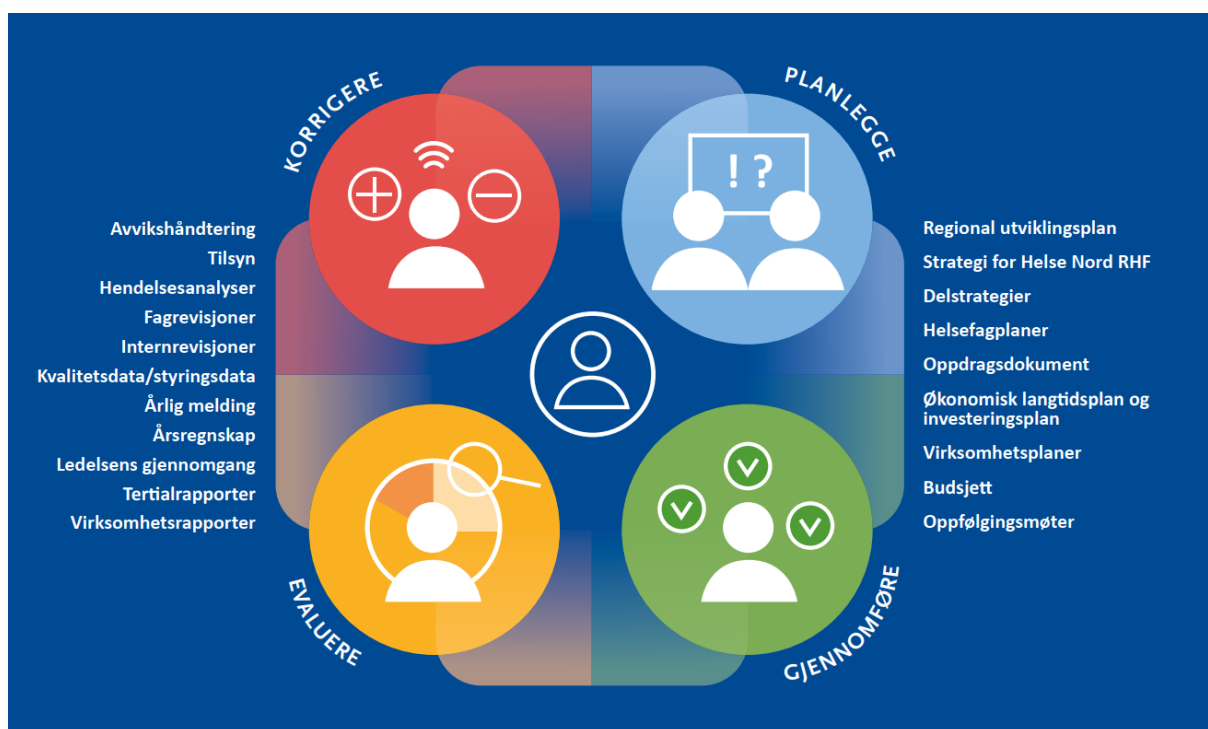
Figur 1- Helse Nord RHF's helhetlige styringsprosess. Vi planlegger og styrer helhetlig og langsiktig i tråd med forskrift om ledelse og kvalitetsforbedring i helse- og omsorgstjenesten.

Helse Nord RHF planlegger og styrer helhetlig og langsiktig. Vi skal være tydelige og forutsigbare i drift og utvikling av spesialisthelsetjenesten. Vår styringsprosess følger forskrift om ledelse og kvalitetsforbedring i helse- og omsorgstjenesten, hvor vi plikter å planlegge, gjennomføre, evaluere og korrigere . Dette sikrer helhet og sammenheng, slik figur 1 illustrerer.